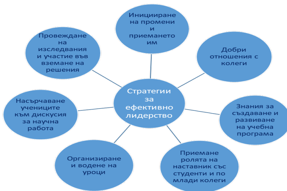
Фиг. 2. Стратегии за ефективно лидерство

Чертите на учителя като лидер и стратегиите, които правят лидерството ефективно, могат да се разгледат на фиг. 2.