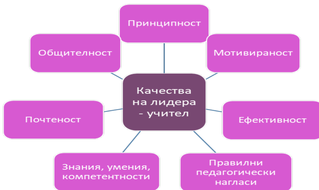
Фиг. 3. Качества на лидера-учител

Всяка основна и отговорна дейност разчита на определени знания, умения и компетенции, които учителят трябва да притежава.