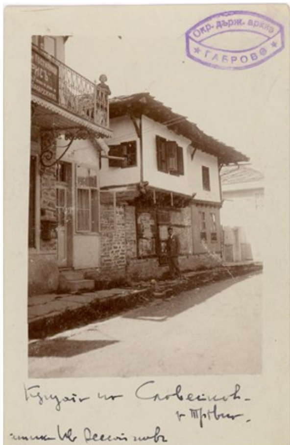
1. Външен изглед на Славейковата къща в Трявна през 1930 г. – Държавен архив – Габрово, фонд 746, оп. 6, а.е. 4