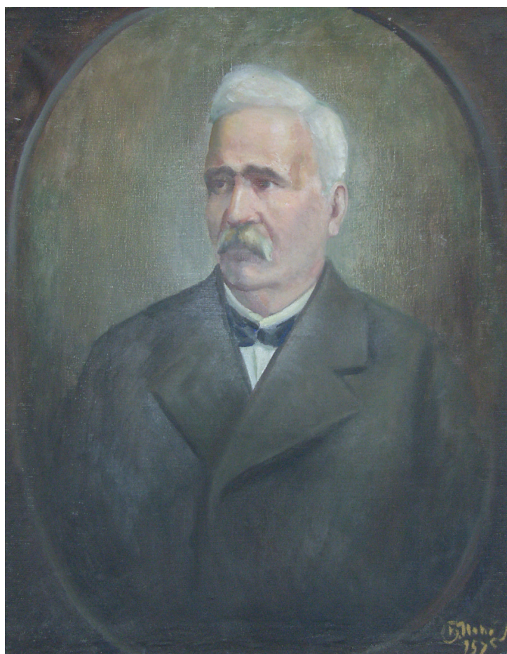
2. Борис Попович. Портрет на Петко Славейков, 1957. Маслени бои, платно. – Регионална библиотека „Петко Славейков“ – Велико Търново