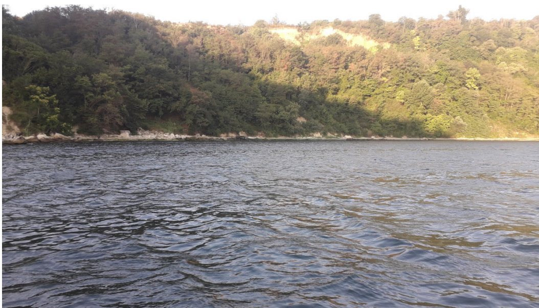
Фиг. 1. Заливът западно от нос Галата.