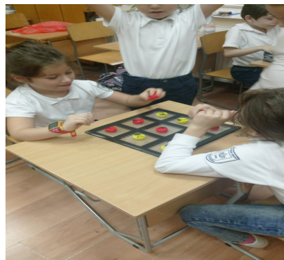
Фигура 1. Игра „Морски шах“ в ателие „Забавна математика“