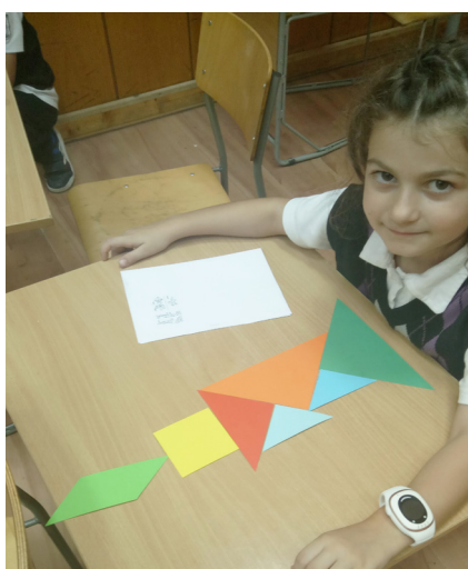
Фигура 3. Игра „Танграм“

Варианти на играта: Играта се играе в серии с усложняващи се правила. Отначало децата опознават елементите на Танграма. После комбинират частите върху схематичен разграфен образац. Най-трудната игрова ситуация е сглобяване в очертан контур (силует на изображението). Разрязаните квадрати и триъгълници са добро средство за разбиране на отношението „цяло-части“ и подготовка за разбиране на обикновените дроби, симетрията и други математически понятия и отношения. Математиката става лесна и интересна, когато децата я преоткрият като малки изследователи и я сътворят чрез ръце.