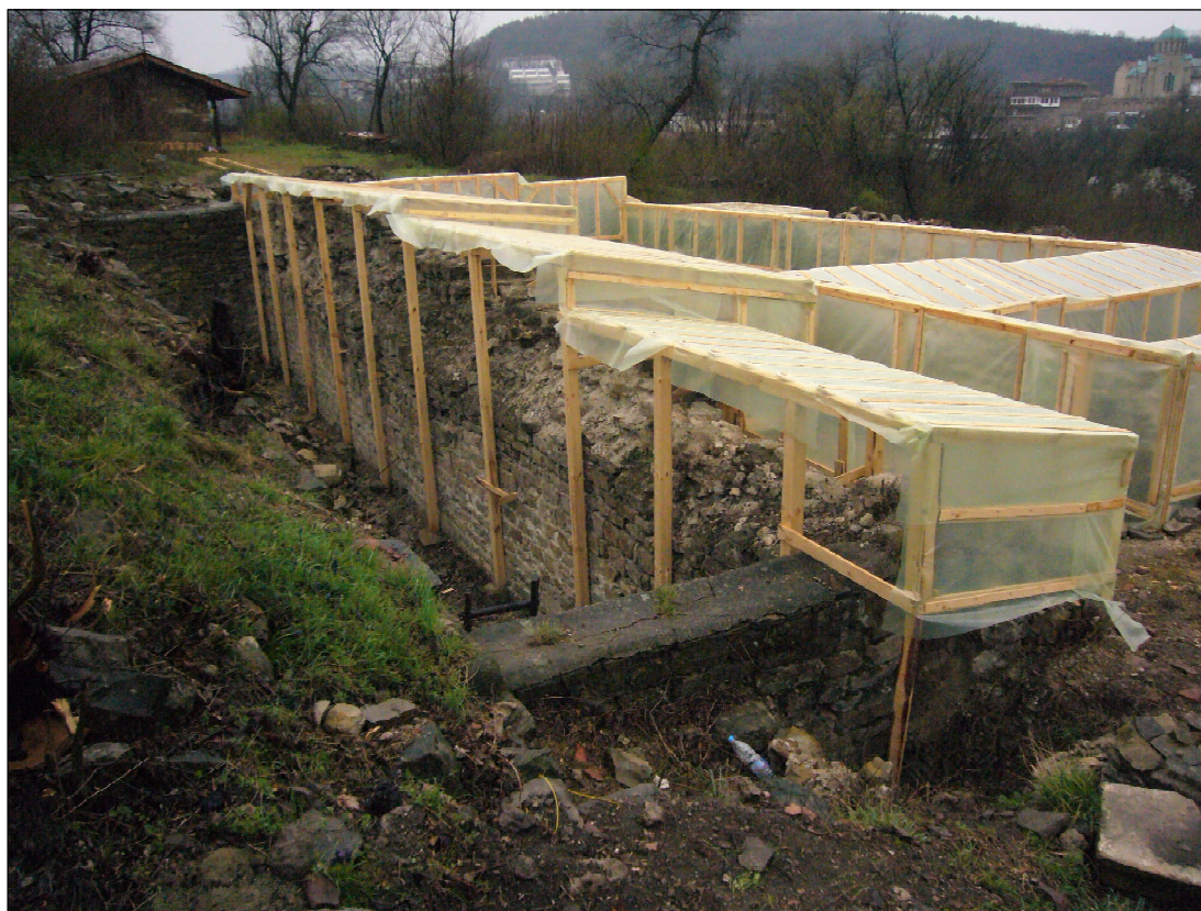
Обр. 4. Защитно покритие на църква № 8 на Трапезица, поставено през 2013 г.