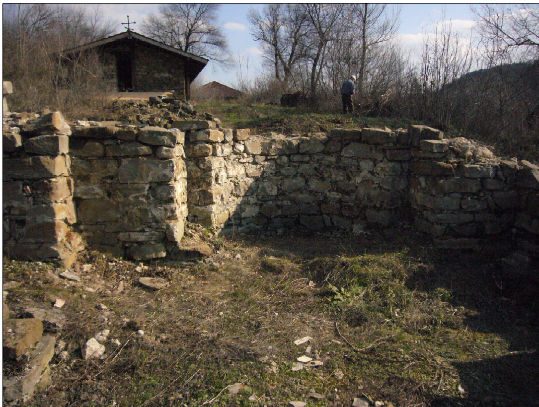
Обр. 3. Апсидата на църква № 8 на Трапезица (фотография 2012 г.)