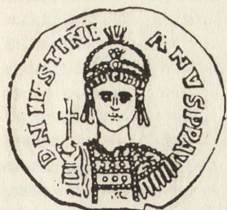
Ил. 4. Изображение на Юстиниан I с военски костюм и императорски шлем украсен с диадема.

тавянето му върху мозайка, стенописи, емайли и кесарските печати на Никифор Мелисенос и Йоан Ангел (ил. 2) 12 . Той представлява златен обръч,