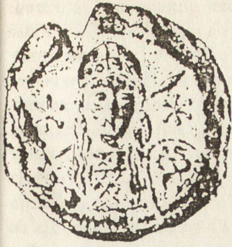
Ил. 1. Печат на хан Тервел, съхраняван в Дамбъртън Оукс до Вашингтон.

родице, помагай на Тервел кесаря”. Върху другото лице е представен самият Тервел в парадно войнско облекло — шлем, ризница, копие, щит и къс плащ (хламида, къс сагий?). Образът е съзнателно портретизиран и отчетливо се долавя твърде дългата коса, стигаща до раменете, подкъсената островърха брада и мустаците. Авторите, които свързваха Мадарския конник с личността на Тервел, получават нов аргумент. Както върху релефа, така и върху печата владетелят е с дълга буйна коса. Но дали такава коса не са носили и останалите ханове? На пръв поглед облеклото на Тервел върху печата обаче е напълно в традициите на византийския владетелски костюм, по точно на ранновизантийския