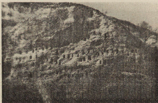
Обр. 1. Скален масив с ниши при с. Странджево

18 Сходна археологическа ситуация е позната в края на I хил. пр. Хр. в Карпатско-Дунавския регион. Вж. Strbu, V. Croyances et pratiques gunèrae cher les Geto – Daces. – Helis, III, Sofia, 1994, p. 147–161.