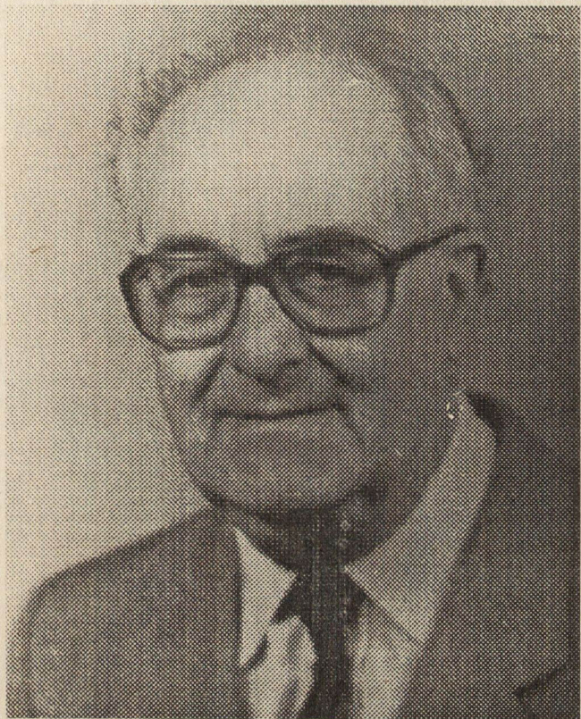
Акад. Димитър Ангелов