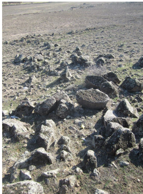
008 Дорожки, ведущие к погребениям 2 в Айтаге (Армавирский регион РА)