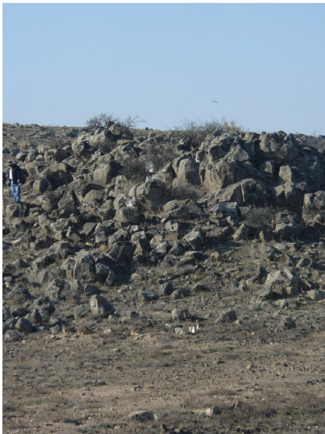
013 Циклопическая стена вдоль могильника в Шаумяне (Армаvirский регион РА)