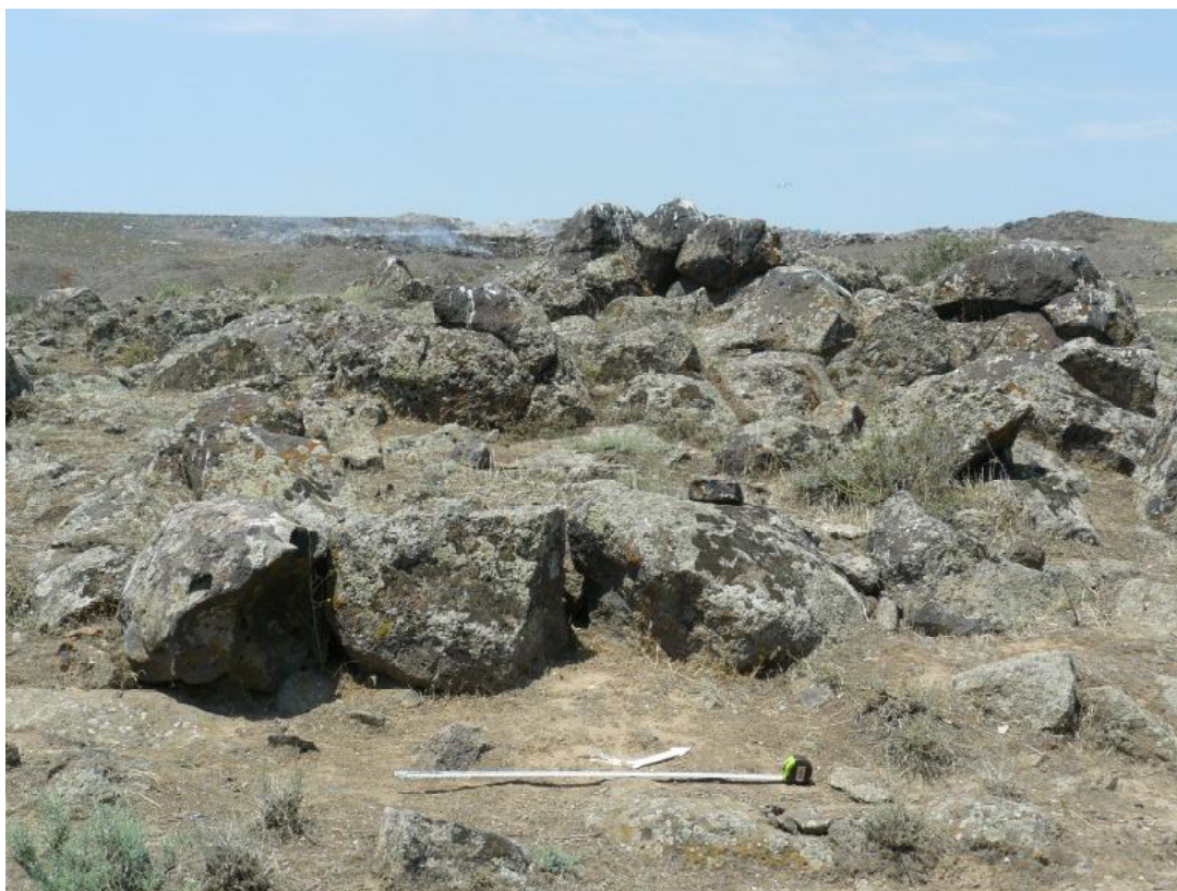
012 Культовая площадка N 1 в в Шаумяне (Армавирский регион РА)