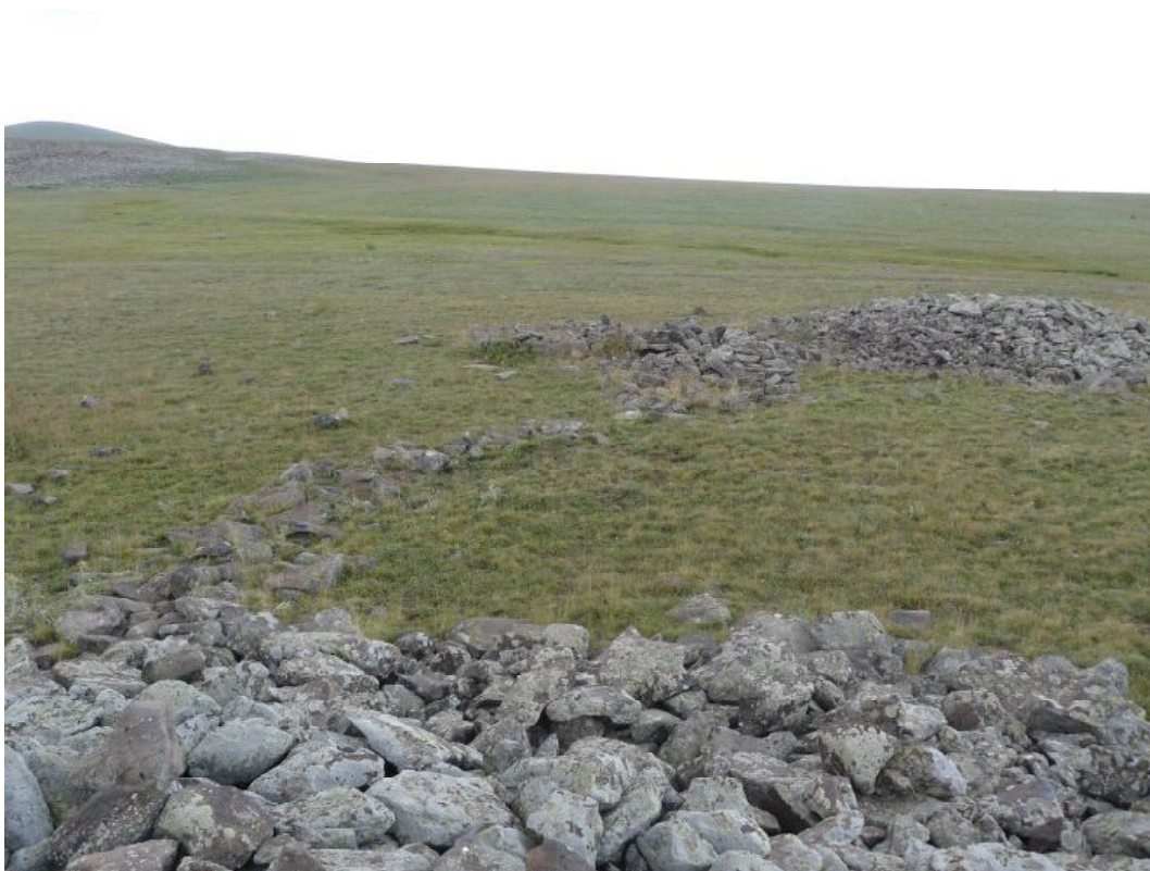
009 Каменная кладка, связывающая «дома исполинов» в Мурад тапа (Вайоц дзорский регион РА)