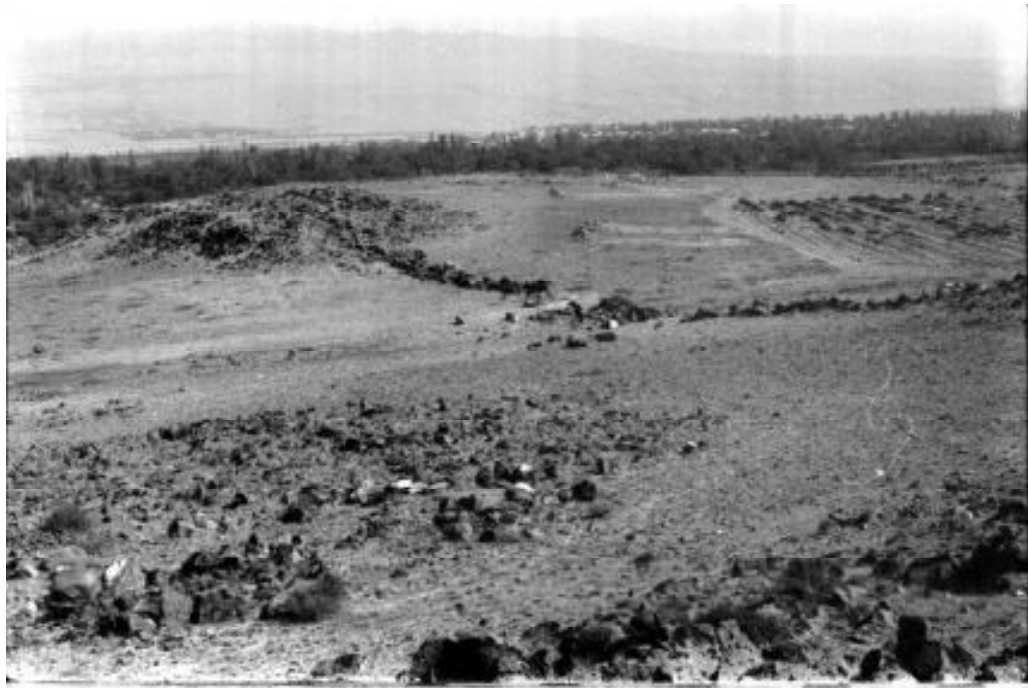
003 Циклопическая стена соединяющая две башни в Айгешате (Армавирский регион РА)