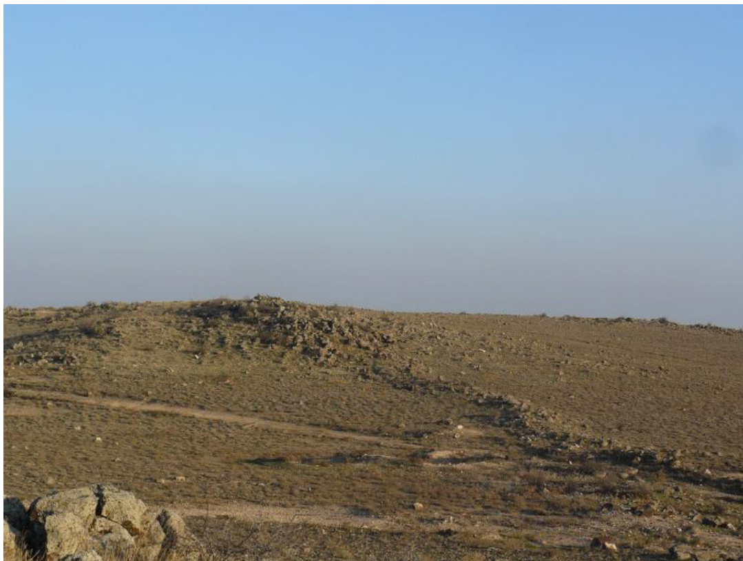
011 Каменная кладка, связывающая культовые башни в Шаумяне (Армавирский регион РА), фото Л. Мкртчяна