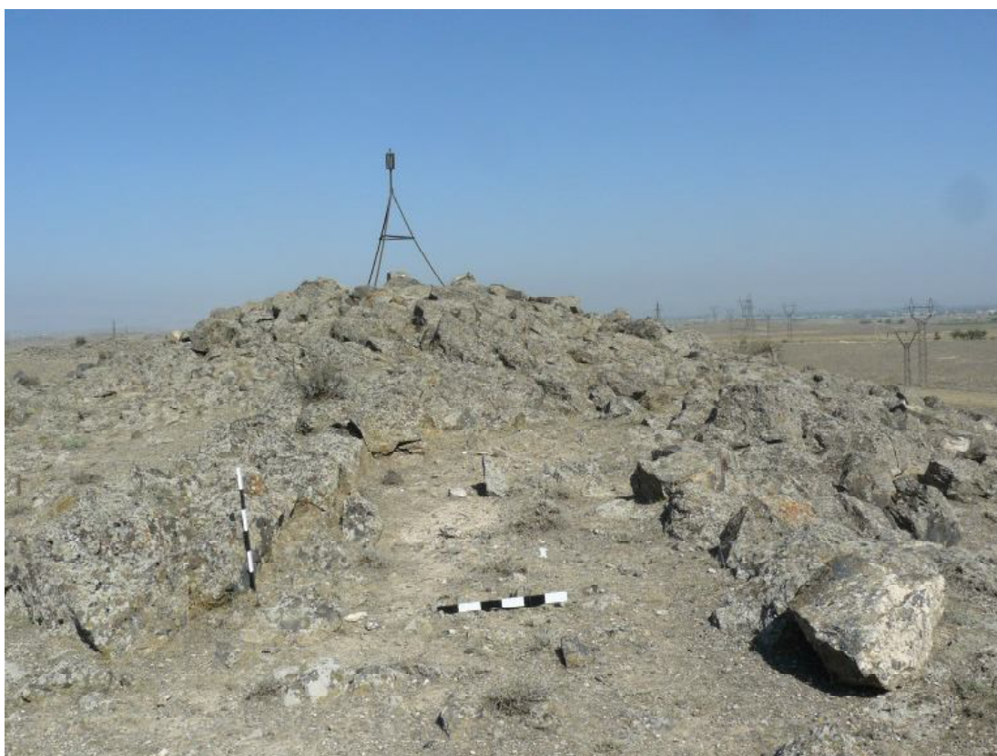
006 Дорога ведущая к культовой башне N 1 в Айтаге (Армавирский регион РА)