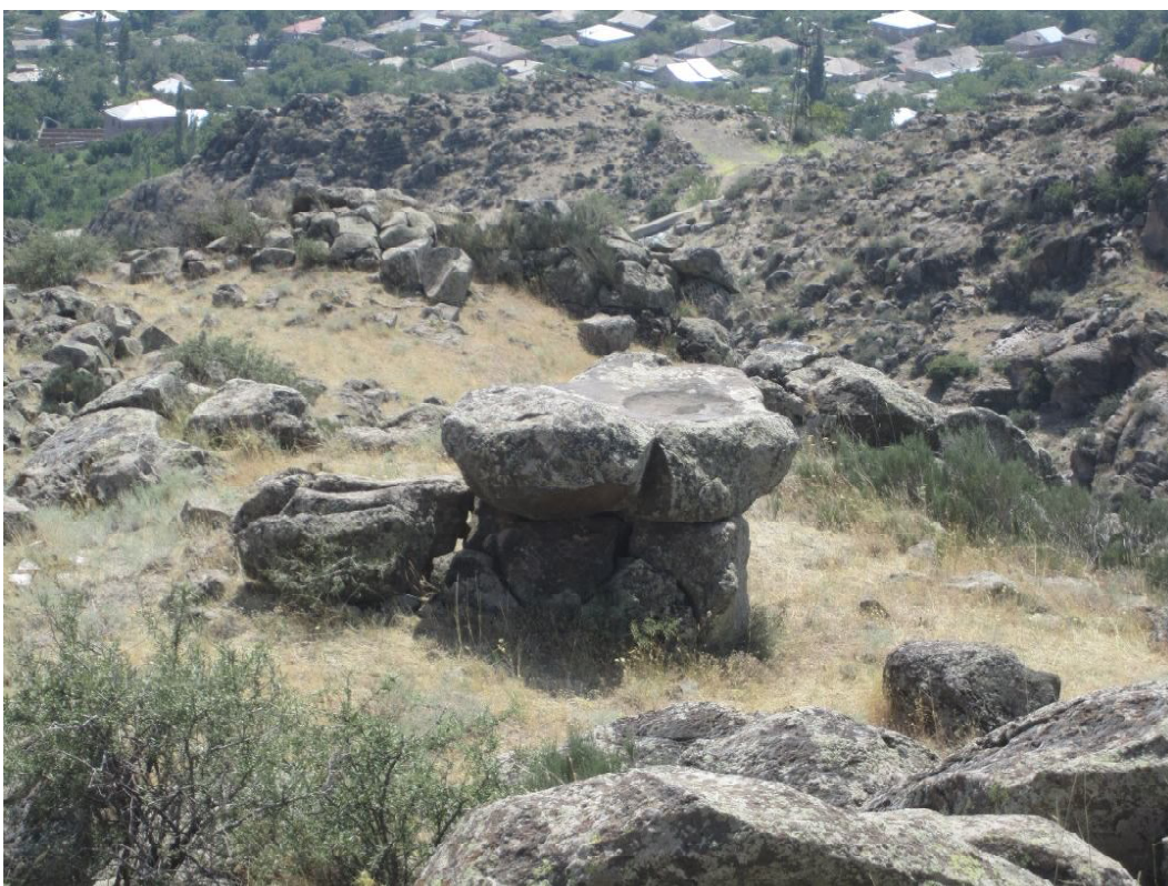
002 Жертвенник в в Уджане (Арагацотнский регион РА), фото Л. Мкртчяна