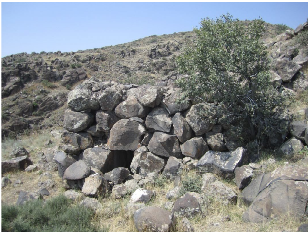
001 Культурная башня в Уджане (Арагацотнский регион РА)