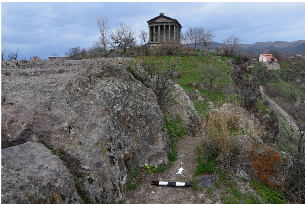
005 Скальная тропинка ведущая к святилищу в Гарни (Котайкский регион РА)