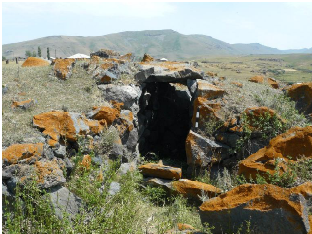
004 «Корридоробразное» погребение в Айрке (Гехаркуникский регион РА)