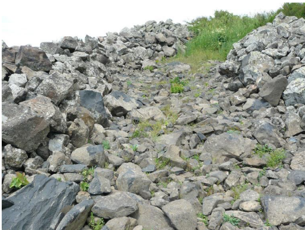
010 Участок дороги ведущей к башне в Капутане (Котайкский регион РА)