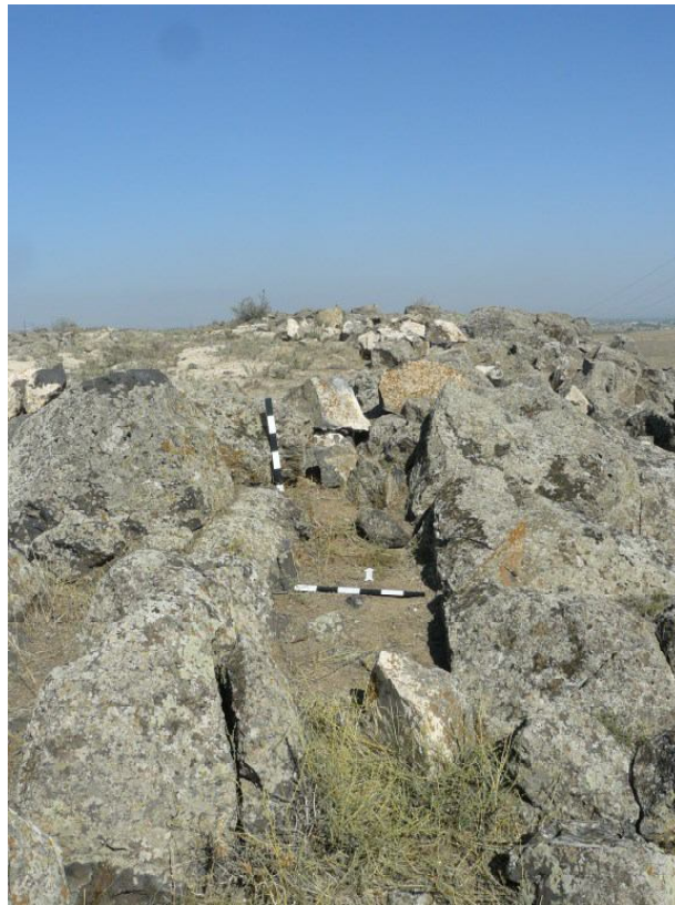
007 Дорога ведущая к культовой башне N 2 в Айтаге (Армавирский регион РА)