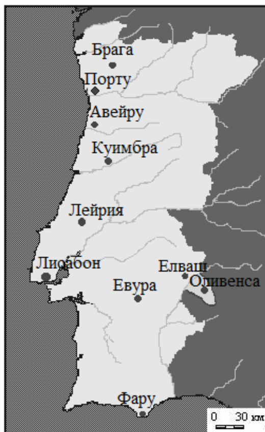
Фиг. 4. Лузо-испанската граница според договора от Бадахос, 1801 г.