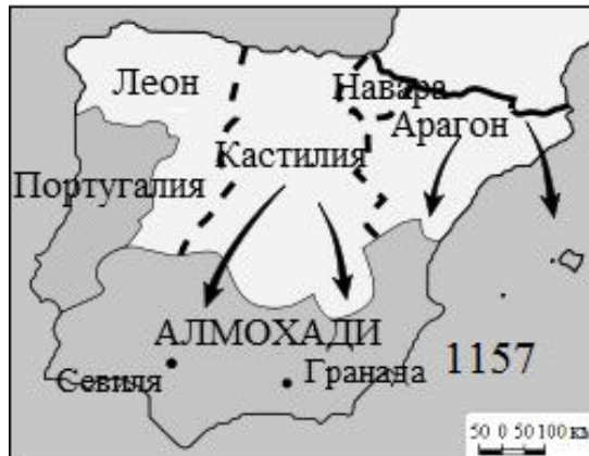
Фиг. 2. Иберийският полуостров през 1157 г.

Така през епохата на Реконкистата в западната част на Пиренейския полуостров започва историята на лузо-испанската граница. И португалското, и кастилско-леонското кралство ще бъдат продължени през следващите години на юг, на пръв поглед без ясно установяване на границите след новите завоевания (фиг. 2).