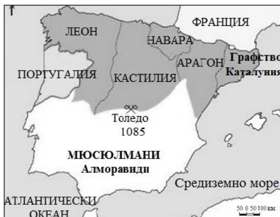
Фиг. 1. Граници на Португалия според договора от Самора, 1143 г.

Римският папа Александър III през 1179 г. със своята Bula Manifestis Probatum признава окончателно независимостта на Португалия и потвърждава кралската титла на Афонсу I Енрикеш [Димитров, С. 2008, с. 14].