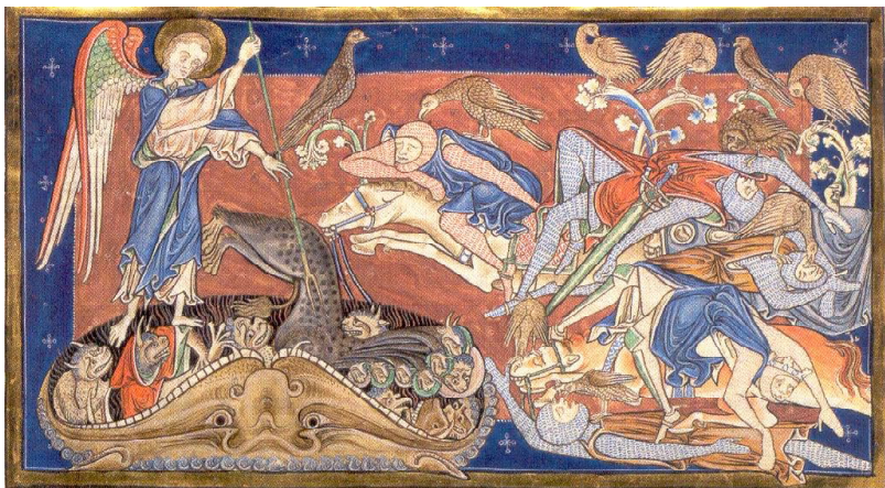
Trinity Apocalypse , fol. 23v.

Победените войски на Звяра и на земните царе.