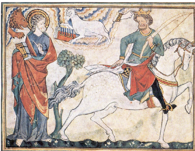
Douce Apocalypse , Pl. 3, p. 13.

Първият конник с къс прав лък с груба предна повърхност.