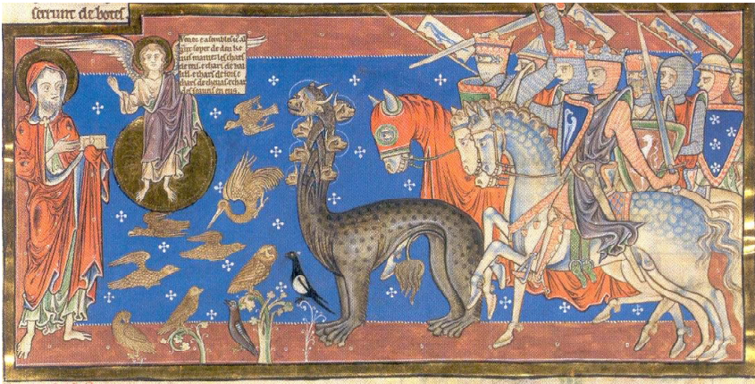
Trinity Apocalypse, fol. 23r.

Синовете на жената като обикновени пехотинци в сражение със Звяра.