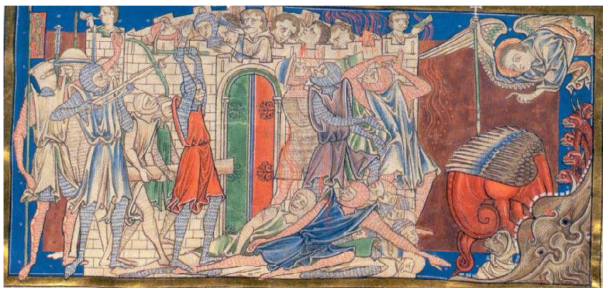
Trinity Apocalypse , fol. 24r.

Победените войски на Звяра и на земните царе.