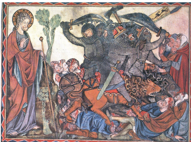
Douce apocalypse , Pl. 8, p. 31.

Първият конник с къс прав лък с груба предна повърхност.