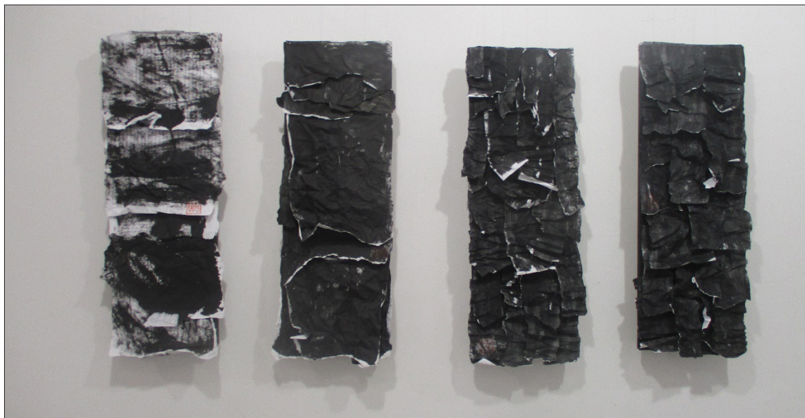
Ил. 5. Серия „Писма“, Лаура Димитрова

В живописните платна на Стефан Алтъков са вплетени текстове и сентенции, части от Евангелието на Матей, житейски мъдрости, изведени като цитати от духовни и творчески вдъхновители за художника. Те са своеобразни послания към зрителя, но всъщност разкриват ценностите и приоритетите на художника, които всеки човек преосмисля и преподрежда по пътя на житейския си ход. Платната въздействат със своите живописни удари, направени сякаш импулсивно, „на един дъх“, с ръка водена от сензитивност и интуиция, но все пак и увереност, придобита на базата на дългогодишен творчески опит. Колоритът от монохромен прелива в контрастен, с наситени и чисти тонове. Линията извежда посоката и движението в композицията. Детайлизиран елемент от картината се явяват растерите и печата.