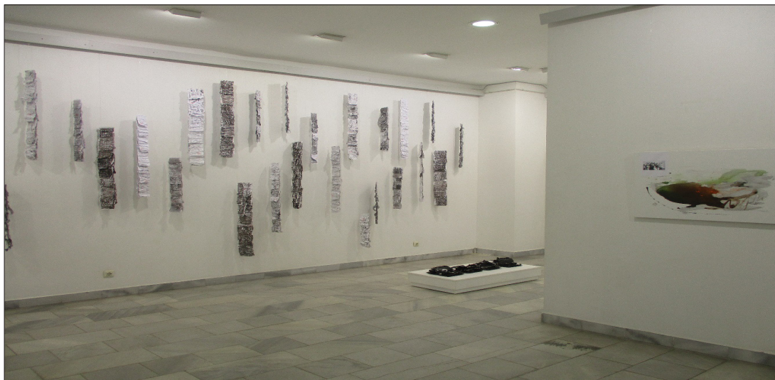
Ил. 1. Изложба „Истории“, ИЗ „Рафаел Михайлов“, В. Търново (общ изглед)

В изложбата авторите разкриват особена гледна точка към личните истории, които в тяхната интерпретация са изчистени, стилизирани и доведени до знаци и абстракции.