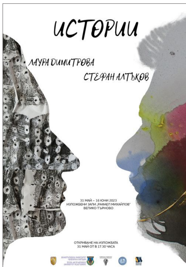
Ил. 12. „Истории“ – плакат на изложбата

Изложбата „Истории“ е едно произведение на визуалните изкуства, променящо се във времето и пространствата, динамично и движещо се, което вероятно ще има различни отгласи и тълкувания от бъдещи изследователи. Но изводът, който може да се направи тук и сега е, че творбите на Лаура Димитрова и Стефан Алтъков носят духа на постмодернизма на XXI век и са принос в съвременното българско изкуство.