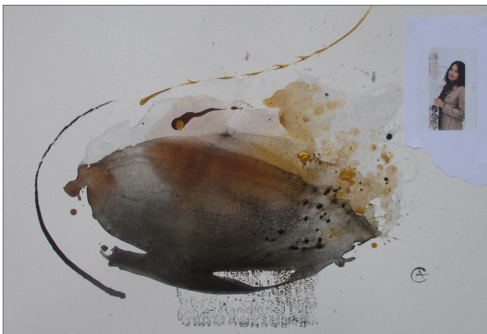
Ил. 11. „Истории VI“, Стефан Алтъков

В последните години на творчество двамата автори създават няколко съвместни творби, в които се допълват идейно и в които отделните части или съставни елементи хармонират до степен на неразпознаваемост.